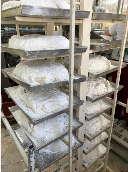
Les pains de nougats

La semaine commence à « l'office » sur le site de Nunziata, on y trouve les bureaux mais aussi la zone de fabrication des nougats.