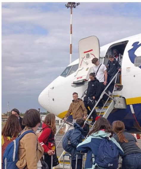
Descente de l'avion à Catania