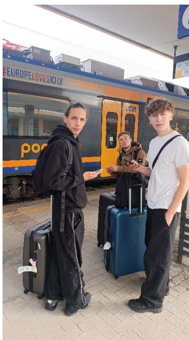
Après le bus jusqu'à la gare centrale de Catania, voyage en train jusqu'à la gare de Giarre