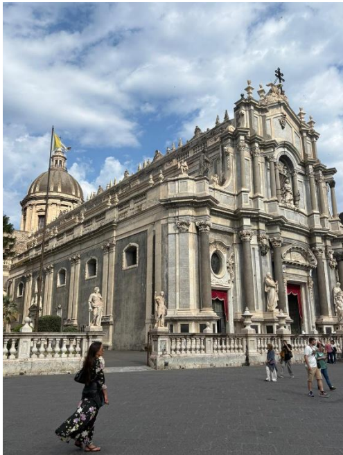
Cattedrale di Sant'Agata

La semaine se termine par un voyage en train pour une petite visite de Catane en autonomie