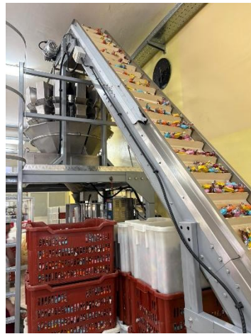
Le convoyeur sauterelle