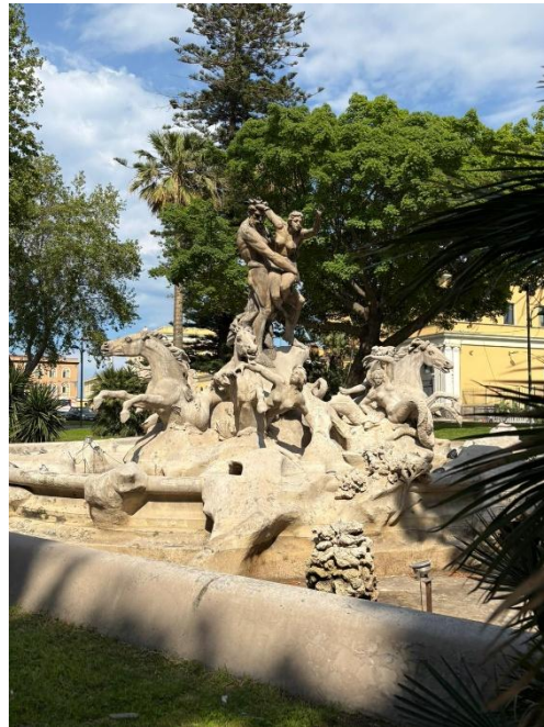
Fontana di Proserpina

La semaine reprend pour l'instant à « l'office » sur le site de Nunziata, sur la partie fabrication des nougats.