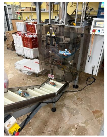
Le convoyeur sauterelle

Cette semaine est arrivée une nouvelle ligne de conditionnement sur le site de Mascali.